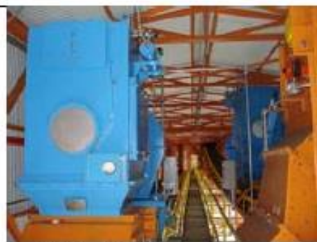
Filtro Bin Vent, instalados no topo de silos graneleiros (fornecedor: Tersel)