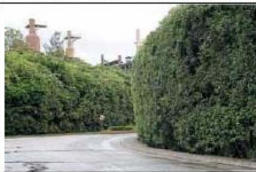
Cinturão Verde SAMARCO, UBU, ES