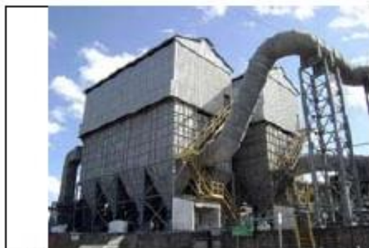
Filtro de Manga em silos de transferência de cargas (fornecedor: Tersel)