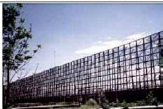
Barreira de Proteção de Vento (SAMARCO - ES)