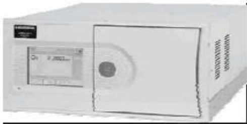
APOA-370CE Monitor de Ozônio (O3)