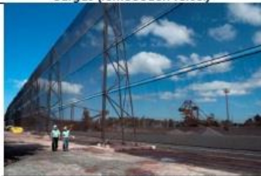
Barreira de Proteção de Vento Estoques - Porto de Tubarão/ES - VALE