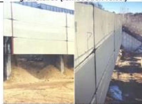
Barreira de Proteção de Vento Pátio Ferroviário em Vermont, EUA