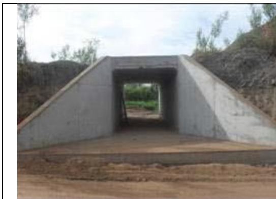
FNS - km 661+700 – PG 3,0x3,0m