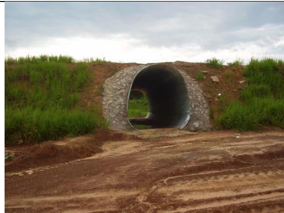
FNS – Passagem de gado ou fauna em tubo corrugado – h=2.27xI=1,70m

As passagens deverão ser projetadas e construídas aproximadamente nos pontos identificados no EIA de cada ferrovia, após suas localizações serem aprovados pela fiscalização do IBAMA.