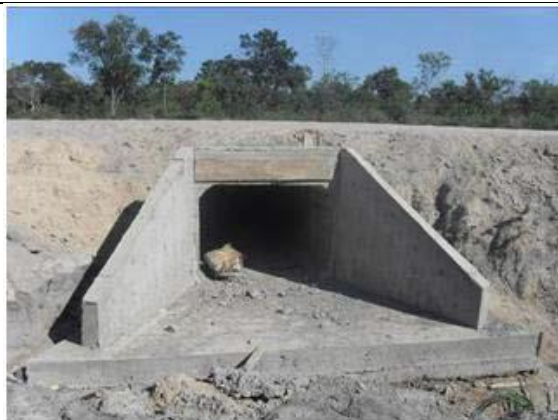
FNS - km 615+620 – BSCC 2,0x1,5m (Corredor ECO - Córrego Sucuri)