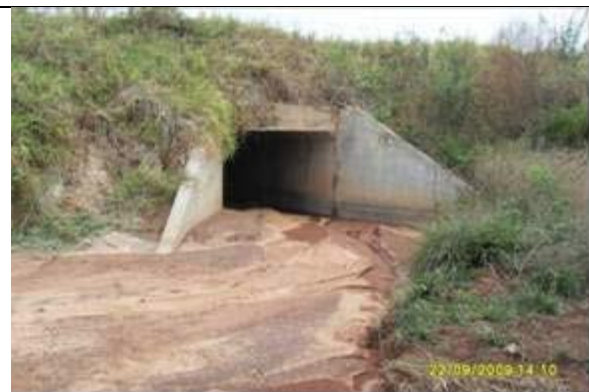
FNS - km 667+84 Corredor Córrego Gameleira