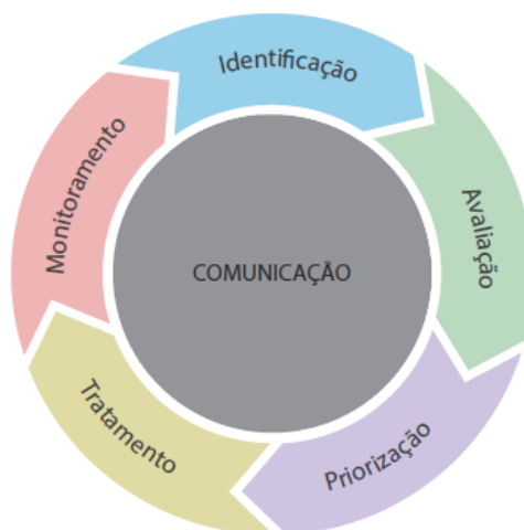
Figura 1 – Ciclo de Gestão de Riscos